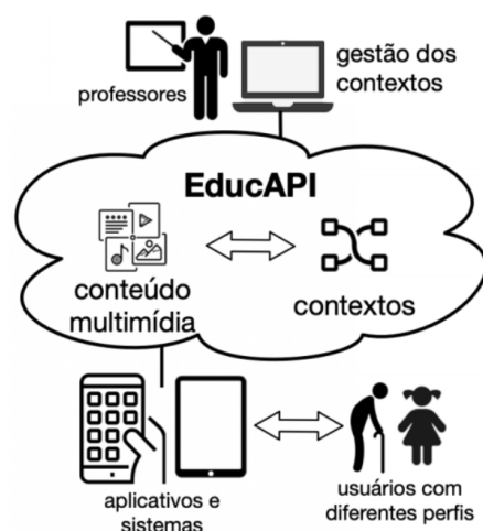
Figura 1. Abordagem Proposta com o EducAPI

contextos e os estudantes poderiam utilizar diferentes objetos de aprendizagem para alfabetização para exercitar a leitura e escrita das palavras cadastradas. A Figura 1 ilustra a abordagem geral do sistema EducAPI com base no que é proposto por Silva, Alves e Rebouças (2017). Espera-se que o serviço possa ser acessado por outros sistemas (e.g. aplicativos) desenvolvidos em diferentes linguagens e que tenham a finalidade de auxiliar no processo de alfabetização de usuários com diferentes perfis (como crianças ou idosos, por exemplo). Os desafios armazenados na base de dados gerenciada pelo serviço podem estar relacionados a um ou mais contextos, e para cada contexto ou desafio pode estar associada a URL de um vídeo, som e imagem relacionados, para tornar a experiência de alfabetização mais lúdica e interessante ao usuário.