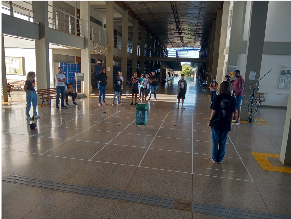
Figura 1. Atividade: Simulando um robô

viamente adquirido pelos estudantes, foi escolhida para esta etapa, a linguagem Scratch for Arduino (S4A) que é uma interface de programação em blocos livre e gratuita, derivada do Scratch, que permite a criação de códigos, para o gerenciamento de sensores e atuadores na plataforma Arduino [Silva et al. 2019].