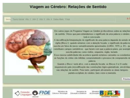
Figuras 4 e 5. Imagem do RED Café com Língua Portuguesa: Morfossintaxe ; e Imagem do RED Viagem ao cérebro: relações de sentido