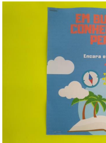
Figura 2: Identidade visual do projeto Caça ao Conhecimento Perdido.