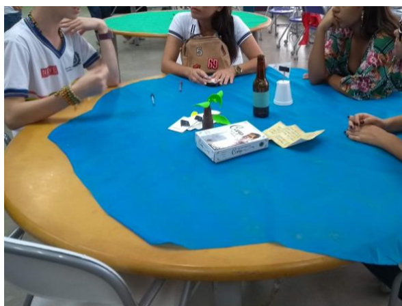
Figura 5: Usuários interagindo com o projeto Caça ao Conhecimento Perdido e seu aplicativo.