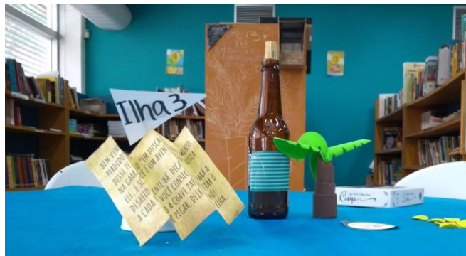
Figura 3: Elementos do projeto Caça ao Conhecimento Perdido.