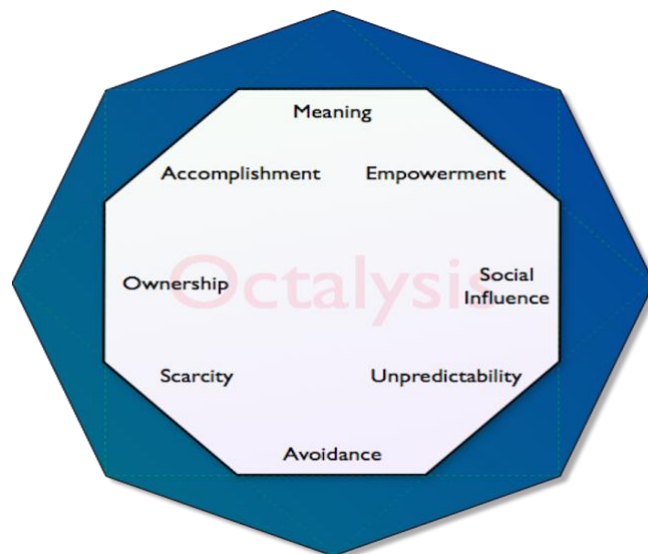
Figura 1: Diagrama da ferramenta Octalysis, baseado em Chou (2015).

Essa apresentação é seguida de exemplos de Gamificação, exibidos em alguns vídeos, destacando as estratégias e os elementos de jogos utilizados em cada situação; o aspecto inovador, o que torna cada um deles interessante e como eles engajam as pessoas em suas dinâmicas. É importante também perguntar aos estudantes, ao final de cada vídeo, quais elementos do framework podem ser observados. Todos os vídeos exibidos são da campanha The Fun Theory, promovida pela Volkswagen em 2010.