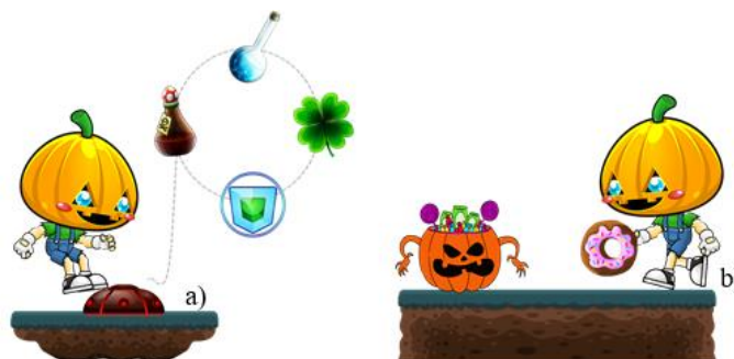
Figura 2. Efeitos das imagens adotadas no jogo

Por sua vez, em relação à função, as imagens dos elementos possuem a função explanatória. De acordo com Reategui (2007), esta função deve ser usada para explicar o funcionamento de um sistema dinâmico, no qual a variável tempo é considerada. Neste caso, obter os elementos depende do jogador, no sentido de aguardar que o recurso possa cair sobre sua cabeça. Foi definido que estes elementos teriam um tempo para ser obtido e caso o jogador saia de cima da estrutura, o elemento a ser obtido para de cair e fica inativo até que ele retorne ao posicionamento da estrutura e espere o elemento cair.