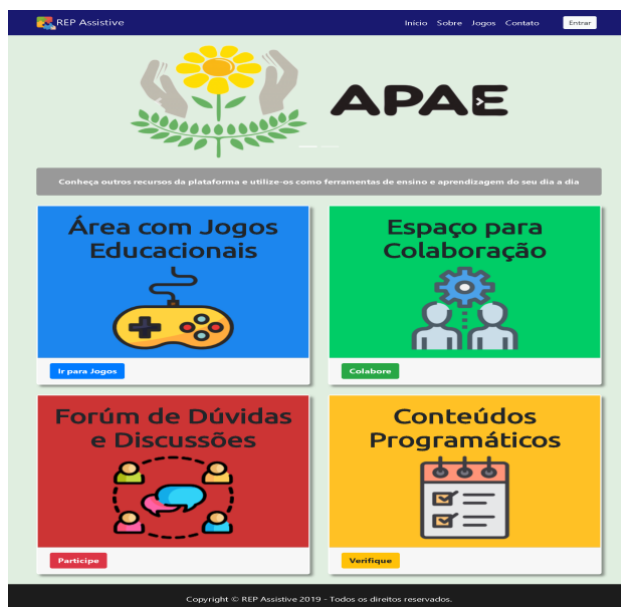
Figura 1. Página inicial do REPAssistive.

Com o propósito relacionado à praticidade no momento do uso, uma interface amigável e fácil de ser utilizada foi desenvolvida. A Figura 1 exibe a página inicial do repositório que conta com um menu na parte superior que dá acesso as demais páginas.