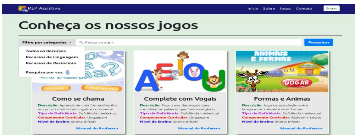
Figura 2. Página de jogos.

apropriado. A Figura 2 apresenta a forma de como os jogos são exibidos e como os mesmos podem ser filtrados.