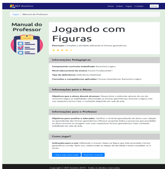
Figura 3. Página do manual do professor.

As buscas pelos recursos podem ser realizadas por diferentes maneiras, tais como: título, nível educacional, componente curricular, tipo de deficiência ou competências pedagógicas. O repositório também permite que as buscas sejam realizadas utilizando o comando de voz, para utilizá-lo, basta clicar sobre a opção “pesquisa por voz” ou no ícone ilustrado por o símbolo do microfone. Como forma de prover auxílio ao educador, foi desenvolvido o manual do professor. No manual, além das informações já descritas no card do recurso, o mesmo contém a descrição detalhada de cada um deles, incluindo um conjunto de dados pedagógicos e técnicas que contribuem para a preparação e condução da aula. Ao observar a Figura 3, é possível identificar a estrutura do manual e a forma de como as informações são expostas.