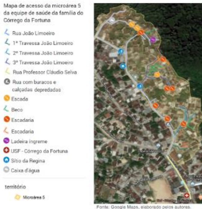
Figura 1 – Mapa de acesso da microárea 05 da abrangência da Equipe de Saúde da Família Córrego da Fortuna, Recife-PE.

Durante as visitas domiciliares as famílias dos territórios, os estudantes realizam a aplicação de dois formulários que são utilizados no processo de trabalho das equipes de saúde: as fichas e-SUS de cadastro domiciliar e individual.