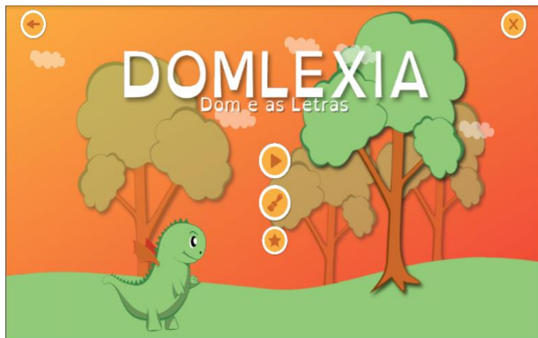
Figura 1: Tela inicial do jogo

conduzido pelo simpático dragão Dom. Ao final de cada uma das cinco fases do jogo, chamadas “mundos”, há uma atividade de avaliação, que permite um acompanhamento do desenvolvimento do aluno ao longo do jogo. Além do uso do jogo, são propostas atividades cinestésicas para sala de aula, com abordagem concreta, fornecendo uma nova possibilidade de fixação do aprendizado.