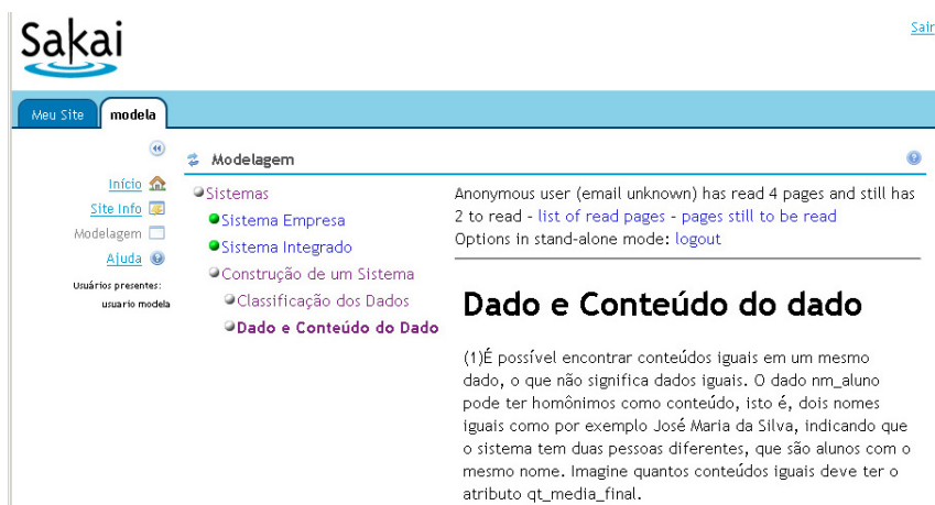
Figura 4. Aplicação Adaptativa em execução integrada ao LMS Sakai.

qual aplicação adaptativa (curso) criada pela GAT deseja acessar, e a partir daí, ter acesso a todos os recursos pertinentes a essa aplicação. Após escolher qual recurso desejar editar, o autor marca o fragmento de texto no qual deseja fazer a adaptação do conteúdo e o editor mostrará todos os conceitos relativos à aplicação e os tipos de relacionamentos entre conceitos (CRTs) existentes, permitindo assim que o autor implemente regras nesses fragmentos.