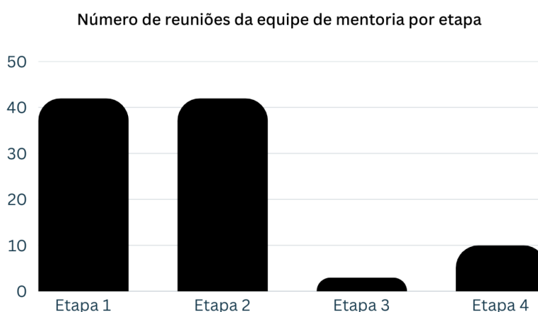
Figura 3. Número de reuniões de mentoria registradas por etapa.

A Figura 3 apresenta o número de reuniões registradas pelas equipes em cada etapa: Etapa 1 (42), Etapa 2 (42), Etapa 3 (3) e Etapa 4 (10).