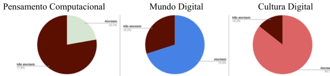
Figura 1. Competências abordadas no currículo estadual do EM de Computação em 2021 a 2023

Quanto ao Ensino Plataformizado, apesar da grande quantidade de aulas de programação, foram observadas poucas competências classificadas como Pensamento Computacional trabalhadas nos dois anos de realização do currículo, mostrando o distanciamento de uma formação estruturada em conhecimentos científicos estabelecidos na área da Computação (Valente et al., 2017; Carvalho, 2023). A Figura 2 apresenta as competências abordadas nesse momento do currículo.