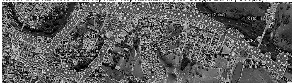
Figura 3. Distribuição de pontos de acesso na zona comercial da cidade de Bom Jesus do Itabapoana.

A figura 3 mostra a distribuição desses pontos de acesso sobrepostos ao mapa da cidade de Bom Jesus do Itabapoana disponibilizado pelo Google Earth [Google].