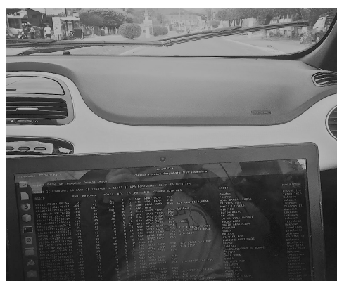
Figura 2. Software utilizado na varredura.

A varredura ocorreu no dia 10/08/2018, a mesma se iniciou no Instituto Federal Fluminense de Bom Jesus do Itabapoana e terminou nesse mesmo ponto, visto que foi feito um trajeto de retorno, totalizando um deslocamento de aproximadamente 5 Km.