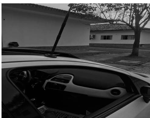
Figura 1. Antena e veículo utilizado na varredura.

Os equipamentos utilizados foram: um automóvel (figura 1), uma antena externa acoplada a ele (figura 1), um telefone celular da marca LG com Sistema Operacional Android , um notebook Lenovo com dual boot dos Sistemas Operacionais Windows 10 e o Ubuntu 17.10 . Foi utilizado o software Aircrack-NG [aircrack-ng.org] no sistema Ubuntu (figura 2) e o aplicativo WiGLE-Wifi [wigle.net] no aparelho celular.