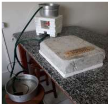
Figura 2. Fotografia do protótipo de piso térmico para suínos.

Na montagem do piso térmico foi aproveitado um radiador de carro, como mostrado na figura 1a e 1b. Duas mangueiras foram conectadas entre as fontes de água quente e fria, permitindo a circulação pela serpentina. Na figura 1c é mostrado o sistema já preenchido com argamassa. Foram utilizados aproximadamente 10 kg de argamassa. O protótipo final apresentou dimensões de 35,5 cm x 30,0 cm x 9,5 cm. A figura 2 mostra uma foto do protótipo terminado e em fase de testes.