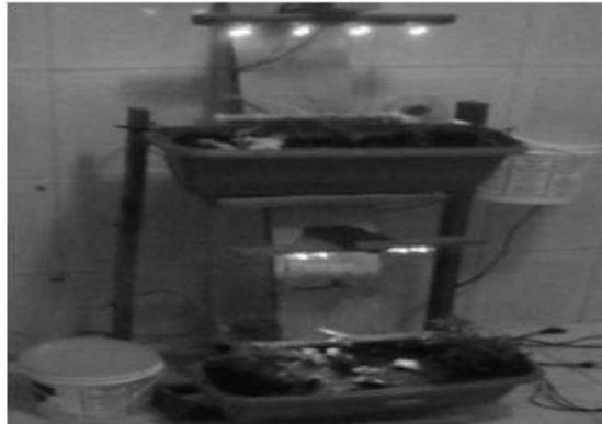
Figura 2 Primeiro Experimento