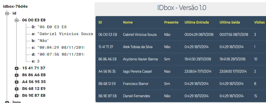
Figura 2. Esquema do banco de dados e interface Web de usuário.

O dado armazenado é dividido em duas principais vertentes, os elementos básicos do usuário a serem mostrados em tempo real e o armazenamento de logs que registram toda e qualquer alteração feita pelo banco e que podem ser exportadas para qualquer tipo de arquivo de texto. Com o armazenamento, a experiência de visualização das informações é feita através de uma página web integrada a um sistema de login e visualização em tabela, além de contar com o registro direto de usuários. Tudo isso de forma integrada, realizando leitura e escrita de dados em tempo real.