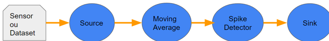
Figura 1. Representação de SD em um Grafo.

A implementação da aplicação Spike Detection segue uma topologia de fluxo de dados representado por um grafo de 4 vértices. A leitura do Dataset simulando envio de dados de sensores ocorre antes da execução da aplicação. Uma representação visual da aplicação em um grafo pode ser vista em 1. As mensagens são enviadas pelos nodos no sentido de Source ao Sink .