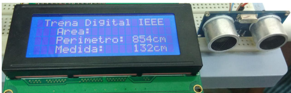
Figura 3. Display mostrando o perímetro e a ultima medida capturada

O protótipo em desenvolvimento já possui suas funcionalidades básicas implementadas. Como mostrado na figura 3, as informações capturadas são já são exibidas no display LCD. Todos os valores lidos ainda estão sendo exibidos em centímetros, contudo, pretende-se criar uma funcionalidade para a conversão destes dados de medição, de forma que possam ser mostrados também em metros.