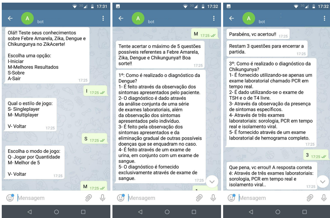
Figura 4. Jogo ZikAcerte disponibilizado na plataforma Telegram.