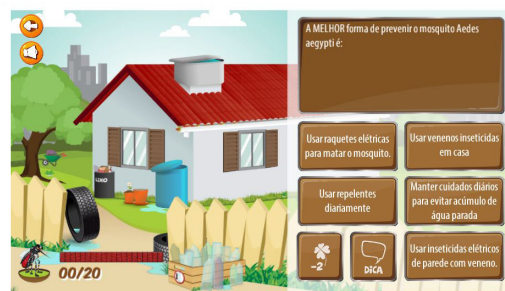
(b) Aedes Game