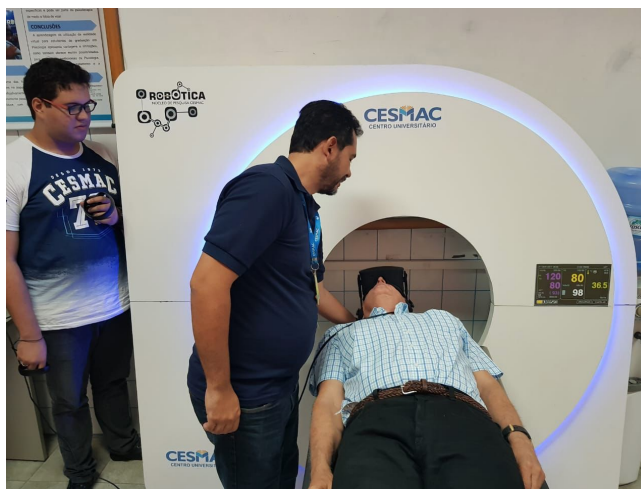
Figura 2. Projeção computacional do exame de RMN

sucesso e de intervenções bem sucedidas, valendo-se da referida tecnologia com propósitos experimentais no tratamento de fobias (PRATES et al., 2016).