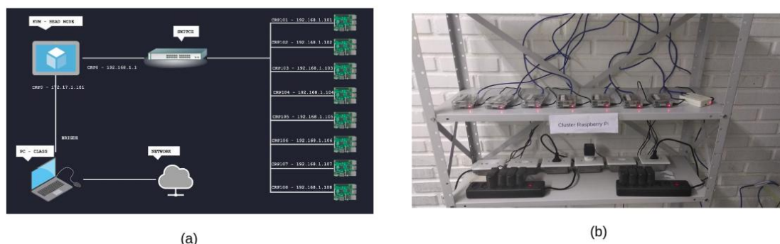
Figura 2. clusters de HPC utilizando 8 Raspberry Pi 3B: (a) Estrutura do cluster, (b) Cluster em funcionamento

Para a realização dos testes deste artigo foi utilizado um equipamento construído, como parte de um projeto inicial, que se propôs demonstrar a viabilidade de montar, configurar, gerenciar e operar um cluster de HPC , utilizando Raspberry Pi , [Moreira et al. 2018]. Como requisito para este equipamento foi colocado que ele fosse capaz de reproduzir o ambiente de operação e gerenciamento semelhante ao que é utilizado no cluster CACAU , atualmente em operação no Núcleo de Biologia Computacional e Gestão de Informações Biotecnológicas ( NBCGIB ) da Universidade Estadual de Santa Cruz ( UESC ), [NBCGIB]. O resultado é um equipamento altamente portátil que pode ser facilmente montado e utilizado em sala de aula para fins didáticos, veja na Figura 2.