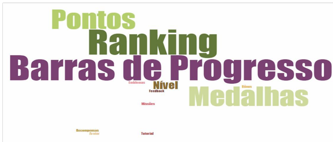
Figura 1. Nuvem de palavras representando a frequência que cada elemento aparece nos artigos selecionados.

A frequência dos elementos de gamificação mais utilizados no AVA “Moodle” que foram encontrados nos resultados dos artigos selecionados e respondem ao questionamento Q1, está ilustrada na Figura 1.