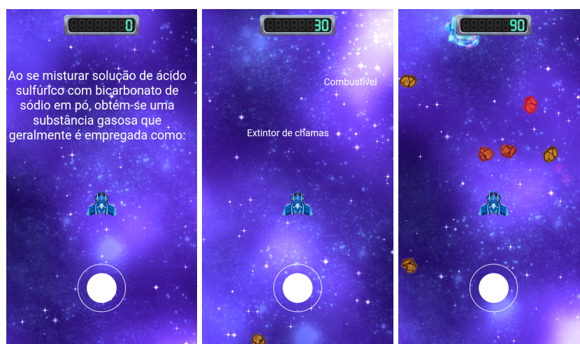
(a) Nova questão. (b) Seleção da resposta. (c) Desviando e destruindo obstáculos.