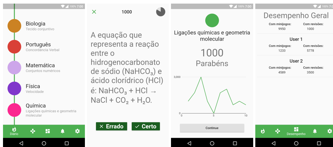
(a) Quadro de revisão. (b) Revisão com Quiz . (c) Resultado do Quiz . (d) Ranking do IFCards.

login na aplicação por meio da conta do Google , o usuário visualizará as revisões diárias disponíveis, organizadas em disciplinas e assuntos, conforme ilustrado na Figura 2 (a). Além disso, o usuário pode escolher, no menu inferior, entrar no modo de revisão com mini jogos Figura 3, visualizar o ranking de jogadores Figura 2 (d), acessar os alertas emitidos ou configurar o aplicativo.