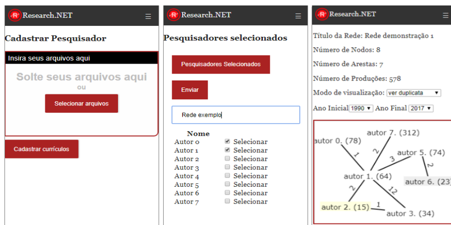
Figura 1. Interfaces gráficas das principais funcionalidades em versão mobile. A identidade dos autores foi preservada neste exemplo. Junto do nodo e aresta é possível identificar o número de produções do pesquisador e coautorias, respectivamente.

Por fim, a aplicação conta com o módulo visualizador de redes que recebe uma rede a ser lida e requisita ao servidor o arquivo da rede (previamente construído). Após a leitura do arquivo o módulo exibe a rede conforme demonstrado na Figura 1.