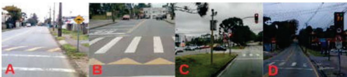
Figura 1. Diferentes tipos de redutores: lombada física (A), faixa de travessia elevada (B), controlador eletrônico (C) e lombada eletrônica (D).

Os radares foram geocodificados pelo Google Street View 1 . Além do uso dos dados governamentais, foi realizado também um estudo de caso in loco na Linha Interbairros II Anti-horário para a obtenção de outro conjunto de dados, com o registro manual de todas as lombadas e radares do trajeto por fotos georreferenciadas.