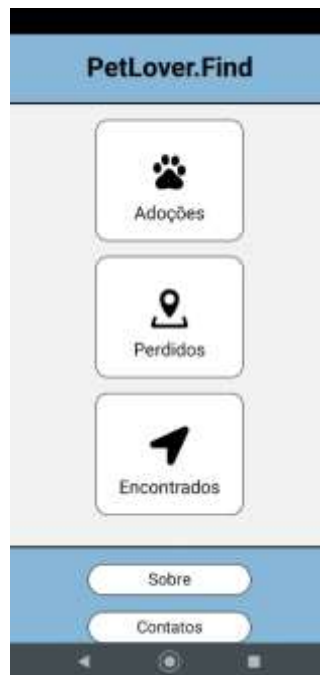
Figura 4. Menu Principal

Pela Figura 3 é verificada a tela destinada a criar uma conta no aplicativo utilizando e-mail e senha. Assim como o login, o cadastro também é baseado no Google Firebase na validação de usuários, além de disponibilizar link para navegar para a tela de login quando o usuário já tiver criado uma conta no aplicativo.