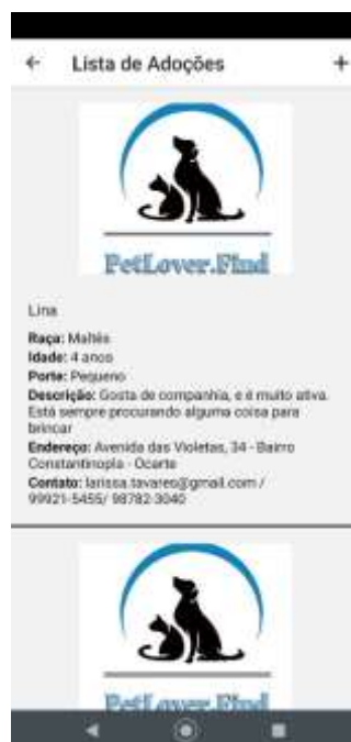
Figura 5. Tela de Publicações para adoção de animais.

Depois de os usuários realizarem o login na plataforma, eles são direcionados para o menu principal representado na Figura 4. Nesta tela são exibidas as funcionalidades do aplicativo, para publicações de adoção de animais, postagens de bichinhos perdidos e a possibilidade de publicação de animais vistos na rua sem responsáveis ou sob cuidado. Além disso as pessoas podem visualizar algumas formas de contato e ler sobre o desenvolvimento da plataforma.