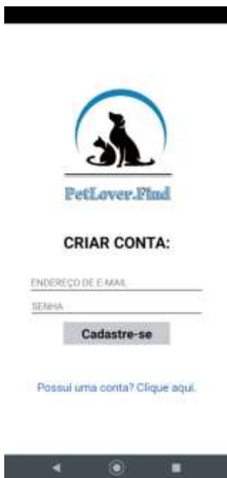
Figura 3. Tela de Cadastro de Usuários.

Na Figura 2 apresenta-se a tela de login para as pessoas já cadastradas na plataforma, onde é solicitado um endereço de e-mail e uma senha. É utilizado o Google Firebase na validação do e-mail e senha inseridos. Também são visualizados o logo do aplicativo e um link de navegação para a tela de cadastro, caso a pessoa não possua uma conta.