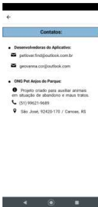
Figura 7. Tela de informações para contato.

Na Figura 7 é visualizada a tela com os dados para as pessoas poderem entrar em contato com os desenvolvedores do aplicativo por meio da disponibilização de duas opções de endereço de e-mail, além de poderem visualizar o telefone e endereço da ONG parceira.