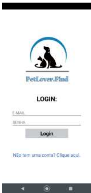
Figura 2. Tela para login de usuários.

Na Figura 1 é exibida a tela inicial do aplicativo com as opções de cadastro e login para usuários. Verifica-se um design simples com o intuito de manter o foco nos itens de ação.