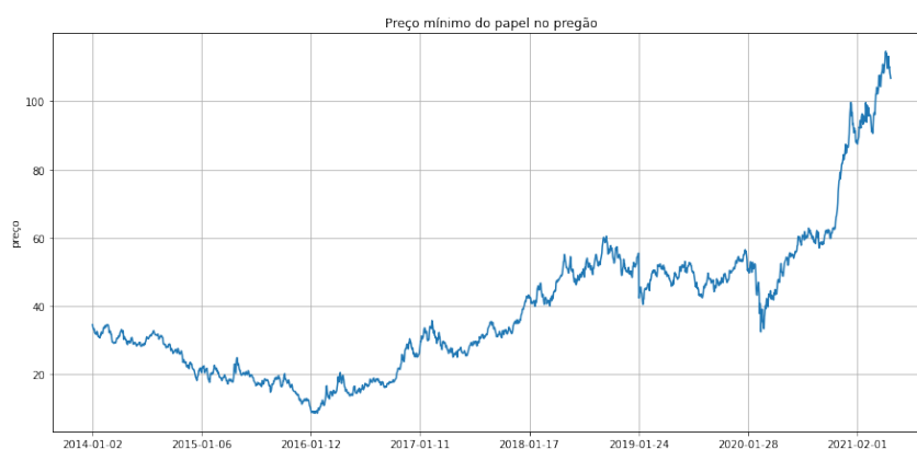
Figura 1. Histórico do preço mínimo durante o pregão da B3 das ações VALE3

Para o presente estudo, foi utilizada uma série temporal univariada. No caso, a série escolhida para ser estudada foi o histórico de preço das ações VALE3 na B3, de janeiro de 2014 até maio de 2021, conforme a Figura 1.