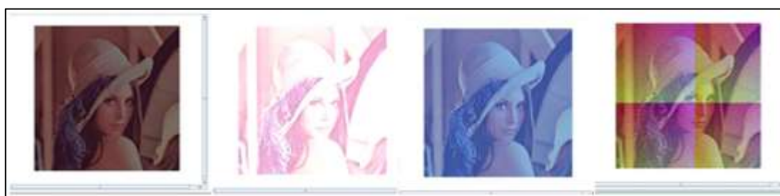
Figura 1. Exemplo da manipulação das cores da imagem.

Logo, ao percorrer a matriz e obter as cores de cada pixel, através da instrução raster.getPixel , tornou-se possível alterar as tonalidades da imagem a partir alteração dos valores (valores inteiros que representam o RGB) de cada pixel e setando-os em uma nova imagem com a instrução raster.setPixel . (Figura 1).