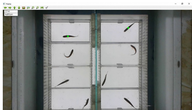
Figura 2. Tela de Seleção de análise comportamental

Os experimentos realizados com o FishTracker foram a partir de vídeos captados no LAPSA/IOC/Fiocruz em tanques retro iluminados contendo até 8 peixes separados em diferentes baias. A figura 2 mostra a tela da aplicação. O usuário deve selecionar, com o mouse, as áreas que serão analisadas. Cabe ressaltar que esta aplicação pode ser utilizada para outras espécies além de peixes.