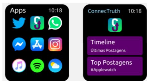
Figura 2. Interface do ConneCTruth no Smartwatch

Na Figura 2, do lado esquerdo é apresentado o logo do ConneCTruth no painel do smartwatch , do lado direito algumas notificações do aplicativo no relógio. O conjunto de telas previstas para os diferentes dispositivos pode ser acessado no projeto Figma descrito na seção 7 deste documento.