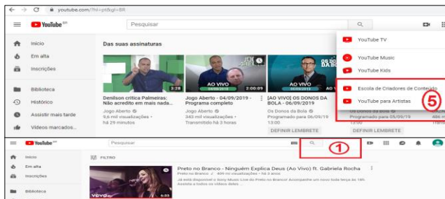
Figura 1: Página inicial e página de busca do YouTube

Na página inicial (lado superior da Figura 1), foram identificados os seguintes problemas de acessibilidade: (1) Não é permitido customizar a quantidade de elementos da tela ( diretriz 2.3 ); (2) Alguns ícones contidos nos botões não representam a função dos botões ( diretriz 1.4 ); (3) Alguns ícones têm baixo contraste com a tela ( diretriz 1.1 ); (4) Existem botões muito próximos e botões com área de clique pequena ( diretriz 7.2 ); (5) Existem ícones iguais com textos diferentes ( diretriz 4.1 ); (6) Não existe uma opção para customizar o layout da página ( diretriz 2.3 ); (7) Existem muitas sugestões de vídeos para assistir dificultando o uso ( diretriz 3.2 ).