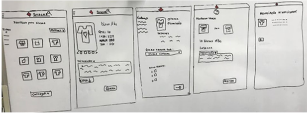
Figura 1: Storyboard para o protótipo