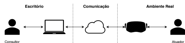
Figura 1: Arquitetura da Solução

Para avaliar a pergunta e hipóteses descritas na seção anterior foi definido que a tarefa de estudo será uma inspeção realizada de forma colaborativa. A Figura 1 apresenta uma visão geral de como funcionará a interação entre os dois atores (nesse caso, duas pessoas). Em um modelo no qual um ator representa uma pessoa experiente na realização da tarefa enquanto outro ator representa a pessoa que está realizando a tarefa.