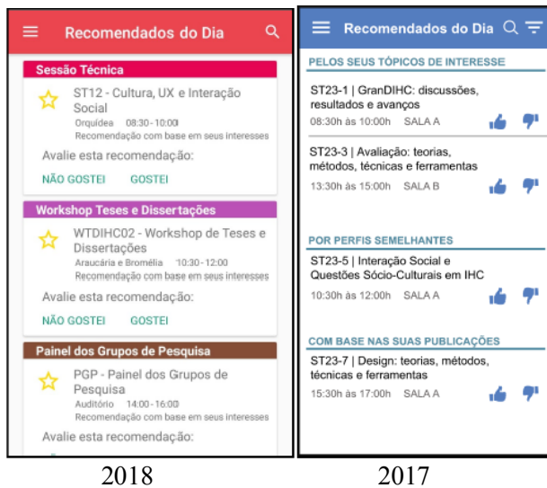
Figura 2: Telas do AppIHC sobre as sessões recomendadas do dia em 2018 e 2017