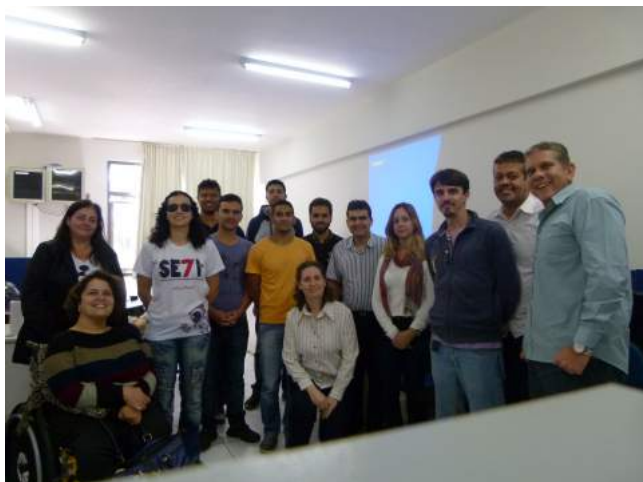
Figura 1: Laboratório de desenvolvimento do ALCANCE em visita da Rede Mineira de Tecnologia Assistiva

A Figura 2 mostra um dos computadores preparado para testes de aplicação com uso de mesa digitalizadora.