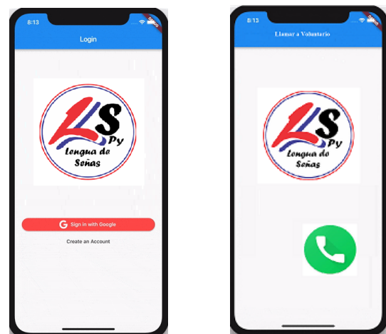
Figura 1. Proceso de autenticación y acceso autenticado.

En esta fase se procede al diseño de la UI ( User Interface ), en la Figura 1 se ilustra del lado izquierdo la pantalla principal con la opción de autenticación inicial con la cuenta de Gmail, una vez autenticada la cuenta se observa del lado derecho la pantalla principal una vez autenticada la cuenta con una interfaz de usuario sencilla.