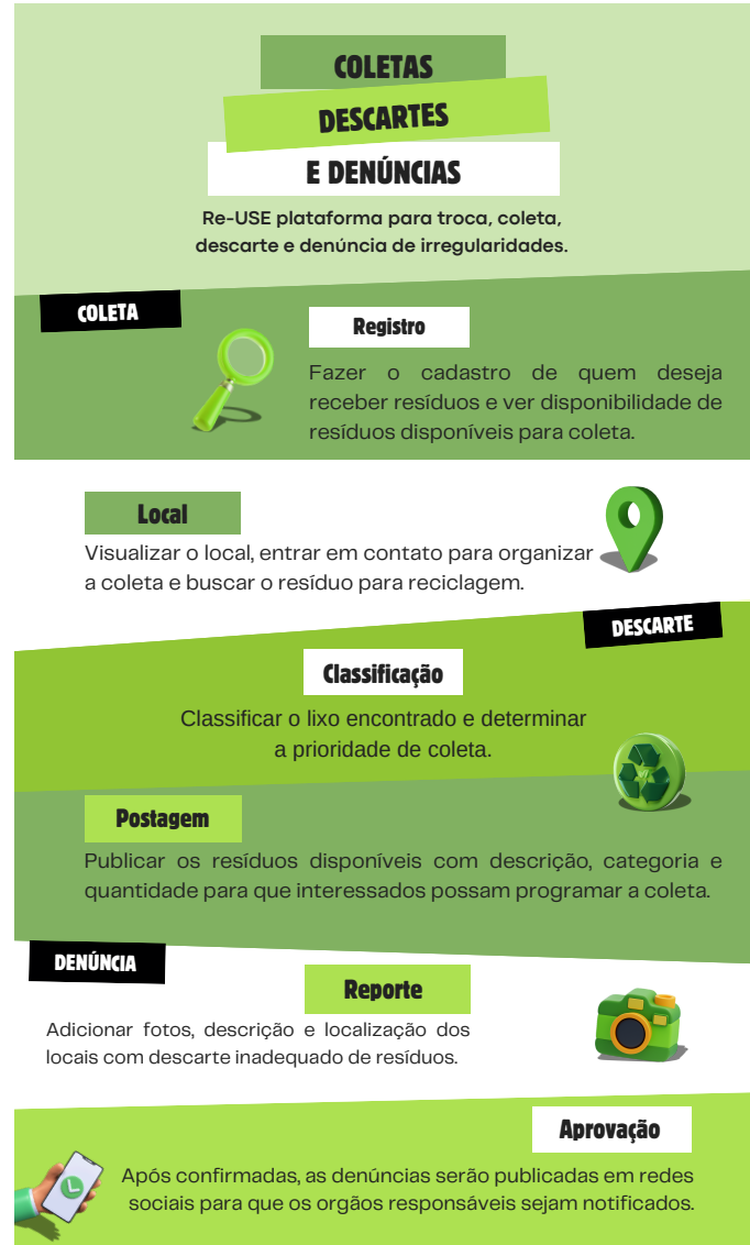
Fig. 1: Fluxograma de interação do usuário com o aplicativo, ilustrando os três módulos principais: Coleta, Descarte e Denúncia.

A Figura 1 apresenta o fluxograma geral das funcionalidades disponíveis no aplicativo, mostrando como os diferentes módulos operam e interagem no sistema. O módulo de Coleta permite que usuários solicitem a coleta de materiais recicláveis, atendendo tanto a quem deseja recolher quanto a quem precisa se desfazer de itens recicláveis. O módulo de Descarte facilita o descarte consciente de materiais recicláveis, podendo ser utilizado tanto por pessoas comuns quanto por empresas, que podem disponibilizar materiais com potencial de reciclagem.