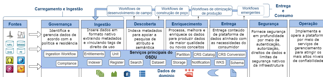
Figura 2. Plataforma de dados OSDU: Ciclo de vida dos dados e Núcleo Básico de Serviços (Adaptado de [The Open Group 2020]).

descritos em JSON, mas a proposta não contempla mecanismos explícitos para extensibilidade de tipos. Uma vez ingeridos, os registros de metadados são indexados, e podem ser localizados através de um mecanismo de busca baseado em Elastic Search.