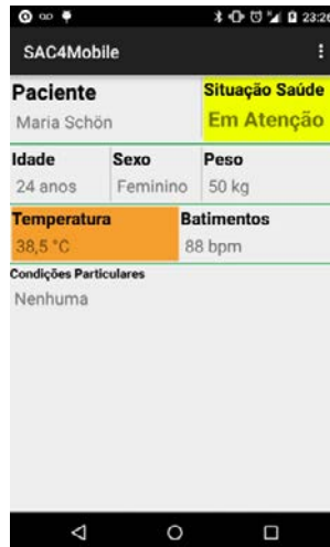
Figura 3. Protótipo SAC4Mobile

SAC e os Serviços SAC, estes dois hospedados na nuvem, Amazon EC2. O monitoramento dos sinais vitais é realizado através de um dispositivo vestível que monitora a temperatura corporal do paciente – desenvolvido utilizando Arduino LilyPad e sensores de temperatura – e de uma smartband que monitora a frequência cardíaca – FitBit Charge HR. Nos protótipos desenvolvidos, o modelo SAC objetivou o menor desconforto ao utilizador da solução. A Figura 3, apresenta o protótipo SAC4Mobile.