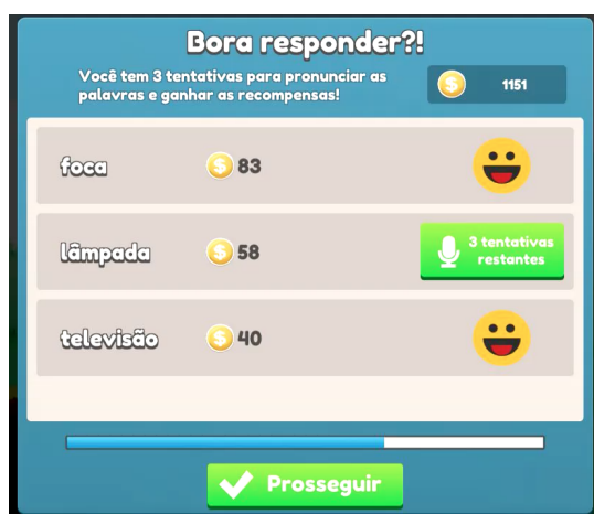
Fig. 3. Tela de pronúncia de palavras surpresa.

Além da coleta direta ao longo das fases, existe uma outra forma do usuário juntar moedas, o desafio de pronúncia de palavras, disponível ao final de cada uma das fases do jogo. A ideia é que o usuário ganhe moedas ao pronunciar corretamente algumas palavras apresentadas ao final das fases. O número de palavras disponíveis para pronúncia está relacionado com a quantidade de caixas surpresa coletadas pelo jogador na fase. Cada caixa surpresa oportuniza a pronúncia de uma palavra. Assim, ao proferir corretamente a palavra da caixa surpresa, uma quantidade de moedas é acrescida a conta do usuário. A Fig. 3 apresenta a tela de pronúncia de palavras.