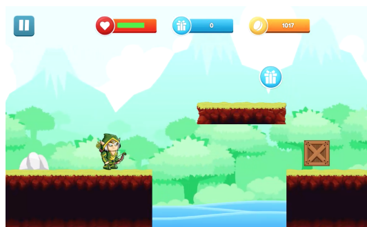
Fig. 2. Usuário jogando a Fase 1 do cenário Floresta .

O jogo, batizado de FonoConnect, foi desenvolvido em duas dimensões (2D) e sua mecânica básica consiste em utilizar um dos personagens disponíveis para percorrer diversas fases em um determinado cenário. Assim, o usuário controla o personagem, coletando itens especiais que aparecem ao longo de cada percurso. O jogo é composto por três cenários principais, cada um deles composto por seis fases de diferentes níveis de dificuldade. O objetivo que o usuário complete todas as seis fases de cada um dos cenários disponíveis em sua versão atual. O jogo inicia na fase um do cenário denominado Floresta , destacado na Fig. 2.