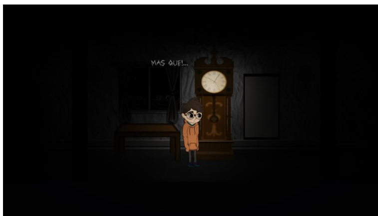
Figura 4. Imagem com o relógio quebrado