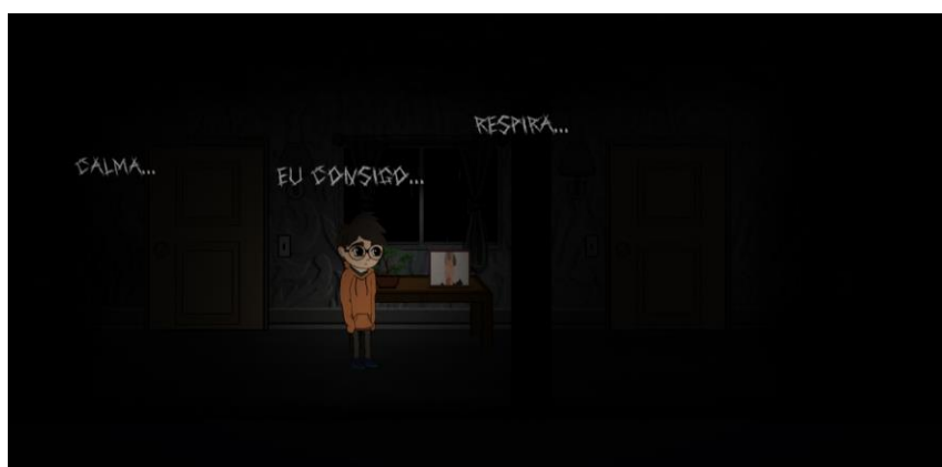
Figura 1. Imagem do ambiente mal iluminado de Tiny Little Hopes

O objetivo das decisões de design é o foco nos textos e narrativa, misturados a ambientação de cenários pouco iluminados (Figura 1). Suas ações como jogador são de locomover-se pelos cenários, interagir com itens e NPC ( non-player characters ) para interação com textos de diálogos e pensamentos do protagonista. Fazendo o uso de pouca iluminação, ressaltando mais um medo do personagem.