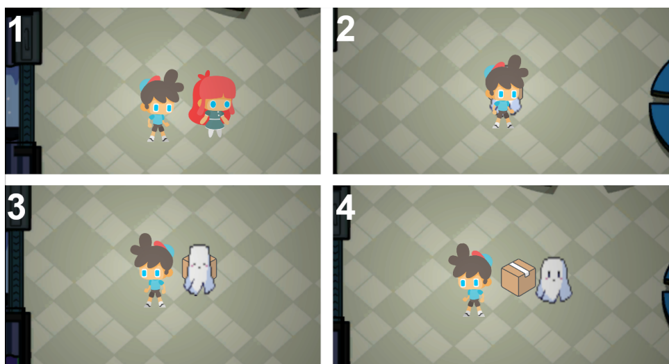
Figura 4. Fluxo de execução da demissão.

Em relação a jogabilidade dos sabotadores, estes irão percorrer o mapa sabotando as tarefas já finalizadas pelos construtores. Os jogadores podem escolher entre embaralhar os modelos US colocando eles em terminais incorretos ou devolver o modelo US correto para o terminal principal, encontrado na parte superior central do mapa (Figura 3). Para realizar essas ações, é necessário pressionar um dos botões, com as respectivas sabotagens em qualquer terminal do mapa.