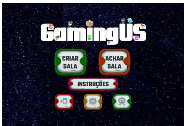
Figura 1. Tela inicial do jogo GamingUS.

multiplayer conforme o estilo de jogo do popular AmongUs . Para tal, GamingUS consiste na realização de tarefas multiplayer que são apresentadas no jogo, as quais são focadas na aplicação correta de US pré-modeladas conforme o padrão proposto no jogo Gamificália.