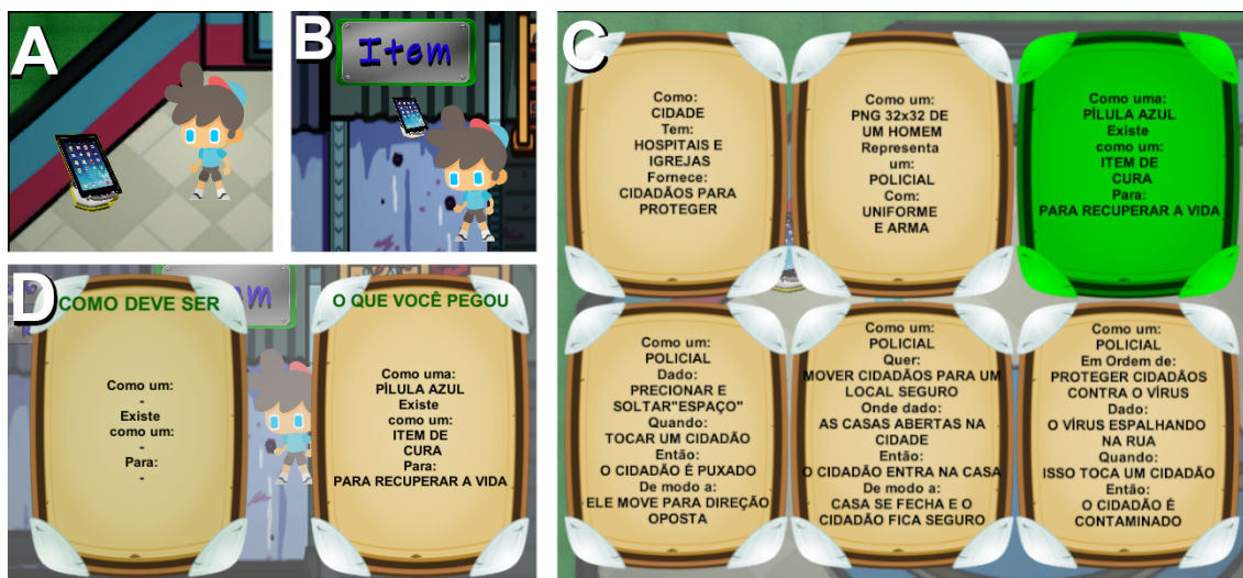
Figura 2. Fluxo de execução das tarefas do jogo conforme modelos de US pré-definidos.

Em cada partida do GamingUS, a maioria dos jogadores serão responsáveis por fazer tarefas (construtores), enquanto que os demais terão a função de sabotar o desenvolvimento dessas tarefas (sabotadores). Os construtores só terão conhecimento sobre sua função, ou seja, não saberão se o outro jogador é ou não um sabotador. Contudo, os sabotadores sabem quem são os outros sabotadores. Cabe aos construtores realizar as tarefas e tentar saber quem é o sabotador, enquanto que os sabotadores terão que impedir os construtores de realizarem suas tarefas sem serem reconhecidos.