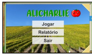
Figura 1 - Tela inicial do jogo AliCharlie

Os capítulos representam os níveis de dificuldade do jogo, sendo o 1º capítulo o nível mais fácil, e o terceiro o mais difícil. Ao adentrar aos capítulos, o jogador pode realizar os desafios (para cada capítulo, são propostos quatro desafios) e recebe seus pontos e suas recompensas (estrelas). Ao finalizar os desafios de um capítulo, o jogador recebe um feedback , tanto da conclusão do capítulo quanto do total de recompensas acumuladas. Quando o jogador completar os três capítulos, o mesmo é direcionado para um quiz, tendo como finalidade avaliar a aprendizagem do aluno durante o jogo. Este é composto de sete perguntas de múltipla escolha, relacionadas com o conteúdo de sustentabilidade alimentar, que foi narrado durante os desafios anteriores.