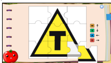
Figura 4 – Capítulo 3 - Nível 1

No Capítulo 2 (nível 2), o nível de dificuldade torna-se médio, e o conteúdo dos desafios muda para os alimentos orgânicos. No primeiro desafio deste capítulo, o aluno precisa resolver um quebra-cabeça de seis peças, usando as setas do teclado para mover as peças. O último capítulo (nível 3) tem o nível mais elevado de dificuldade, e o conteúdo dos desafios estão relacionados aos alimentos transgênicos. A Figura 4 mostra o primeiro desafio, onde o aluno precisa resolver um quebra-cabeça de nove peças, usando as teclas: A (mover para à esquerda), D (mover para à direita), W (mover para cima) e S (mover para baixo).