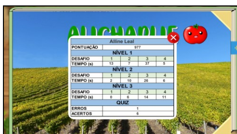
Figura 6 - Tela de relatório

Já no segundo desafio, presente em todos os níveis, a coordenação motora do aluno é avaliada por meio da fórmula da Lei de Fitts. Neste desafio, é calculado o tempo que o aluno leva para contornar a figura geométrica proposta (arrastando com o mouse a imagem circular que está posicionada em cima da mesma). O cálculo foi realizado com base no experimento proposto por Okazaki et al. (2011) e a implementação interna do jogo calcula o desempenho do aluno por meio do perímetro e espessura da figura (em pixels), considerando o tempo que o aluno levou para contornar a figura. Neste desafio, caso o aluno solte a figura, a imagem continua no mesmo lugar, e o tempo segue sendo computado. A Figura 6 mostra a tela de relatório do jogo, que mostra o tempo em segundos que são computados ao completar os desafios 1, 2 e 4, e a quantidade de imagens obtidas nos desafios 3 – quanto mais imagens coletadas, melhor o desempenho do jogador.