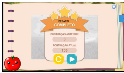
Figura 5 - Tela de feedback

A Figura 5 também mostra o personagem Charlie, a fruta tomate (relacionada com o tema de segurança alimentar), localizada ao lado inferior esquerdo da tela – presente em todos os desafios. A escolha do personagem deu-se devido o tomate ser uma fruta conhecido pelos alunos [Silva and Maciel 2018].