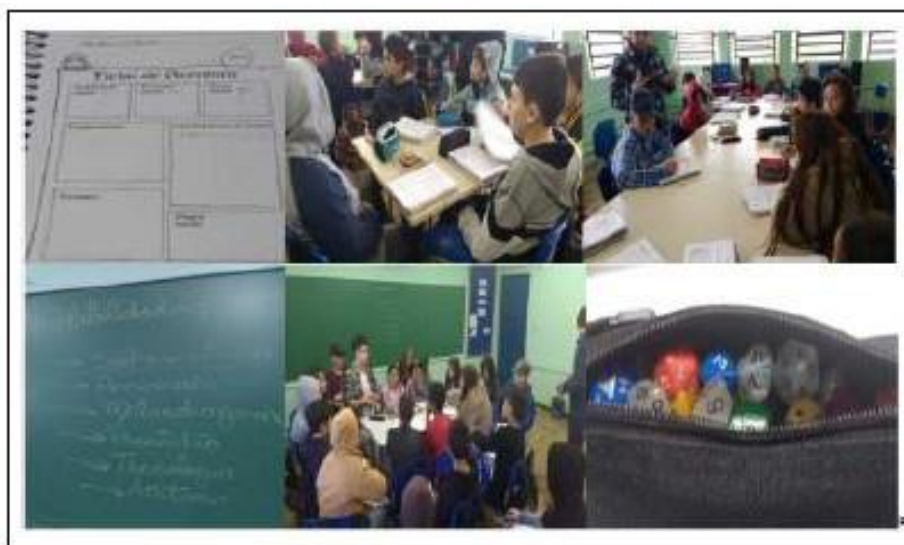
Figura 02 – Primeira experiência com um jogo RPG

Em seguida o professor apresentou a categoria de jogos conhecida como RPG ( Real Player Game ). Uma das justificativas para a escolha dessa categoria foi pela dificuldade de acesso às tecnologias digitais na unidade escolar.