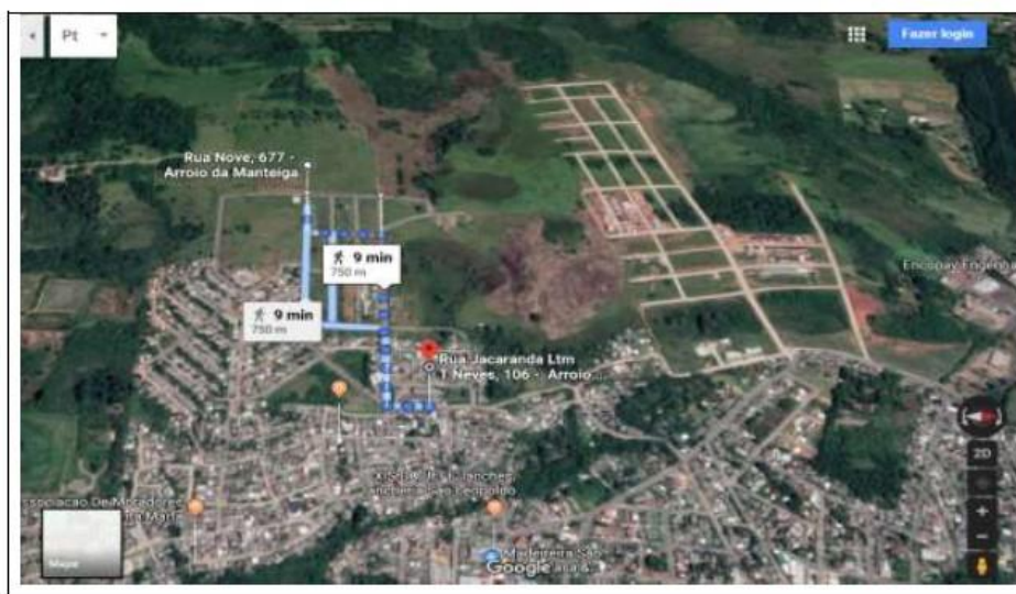
Figura 03 – Percurso da narrativas

Ao ler as narrativas o professor teve a ideia de selecionar elementos delas, para com eles inventar uma nova narrativa, desconhecida dos estudantes, que poderia ter elementos de mistério. Essa narrativa deveria ser vivenciada pelos estudantes, portanto o cenário dela era a própria escola e a comunidade.