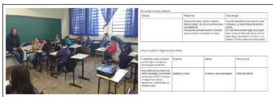
Figura 01 – Pré concept dos alunos 2018

A atividade iniciou com o pré concept [Schlemmer 2014], onde o professor e os estudantes relataram quais os games que conheciam e quais eram suas características.