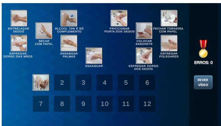
Figura 2. Módulo de Lavagem de Mãos

Este trabalho não foca o design de jogos, pois tem a proposta de ser aderente as características de um grupo de pessoas específico de idade adulta, porém com uma faixa de idade ampla e de diferentes gerações, as quais apresentam habilidades distintas em relação ao manuseio de tecnologias. Os módulos foram desenvolvidos através de jogos de quebra cabeça com elementos visuais de cards e simulador de ambiente 2D com movimentação de elementos em tela, por serem compreendidos com maior facilidade pelos jogadores [Vostinár P 2021] e por apresentarem características não infantis, o que é desejável para o público específico do jogo. Para o desenvolvimento foi empregada a plataforma Unity [Haas, John 2014], através do uso da linguagem C# [Priour B 2020], em plataforma Web para ser executado em navegadores da internet, permitindo acesso ao jogo a partir de computadores desktop , tablets e celulares. Optou-se pela plataforma Web para facilitar a utilização pelo público específico deste jogo (profissionais de saúde que atuam na atenção básica em seu próprio local de trabalho), permitindo o acesso por qualquer dispositivo.