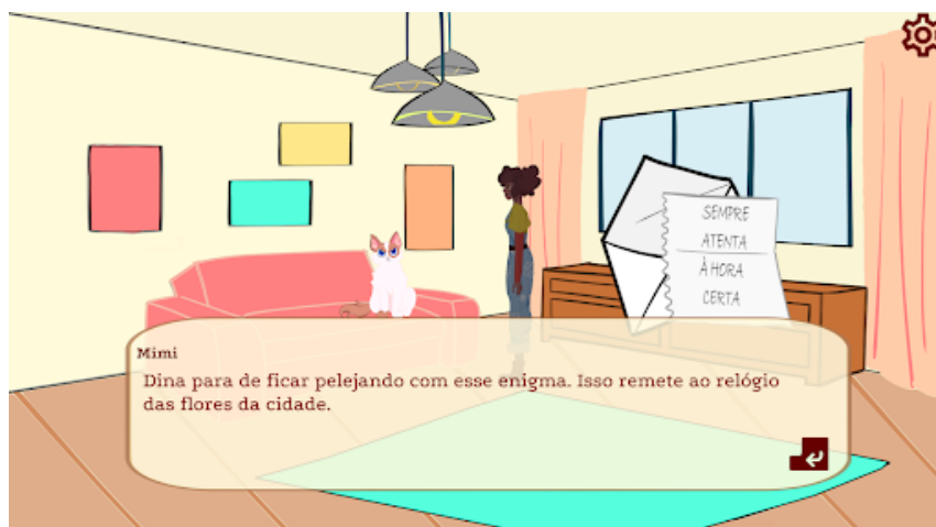
Figura 1. Discussão sobre Bilhete Misterioso

de grupo focal e questionário semi estruturado. Foi realizada uma análise minuciosa, relacionando os dados obtidos por meio dos instrumentos de coleta de dados. Dessa forma, foi possível estabelecer conexões entre diversas informações significativas para a compreensão do fenômeno estudado.