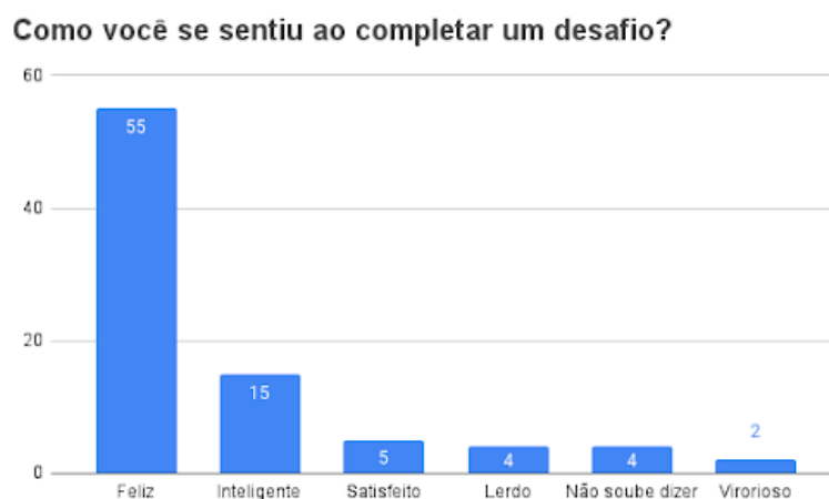
Figura 7. Sentimentos Despertados

Pensando nos sentimentos despertados pela superação dos desafios e obstáculos, eles foram questionados sobre como se sentiram durante esses momentos no jogo. O intuito era verificar quais respostas emocionais o jogo provocou nos participantes. Isso pode ser observado no gráfico da Figura 7.