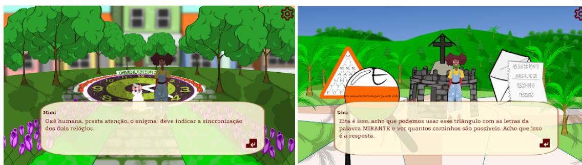
Figura 3. Diálogo: Expressões Regionais

nova pista enigmática: “AO SUL DO PONTO MAIS ALTO SE ESCONDE O TESOURO”. Essa pista instiga ainda mais a curiosidade de Dina e Mimi, direcionando-as para o ponto mais elevado da cidade, o Cristo do Magano, onde a próxima etapa do desafio aguarda.