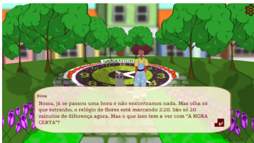
Figura 2. Representação do Relógio de Flores de Garanhuns

nova pista enigmática: “AO SUL DO PONTO MAIS ALTO SE ESCONDE O TESOURO”. Essa pista instiga ainda mais a curiosidade de Dina e Mimi, direcionando-as para o ponto mais elevado da cidade, o Cristo do Magano, onde a próxima etapa do desafio aguarda.