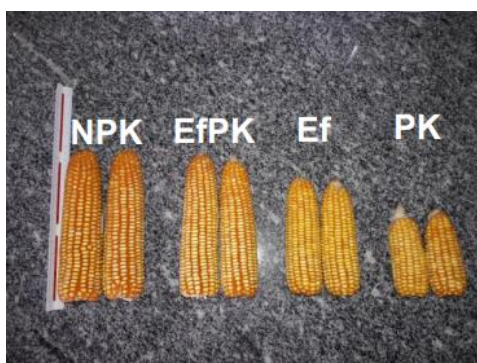
Figura 1: Diferenças entre espigas de milho produzidas no experimento de Abreu et al. (2022) sendo usada a adubação mineral (NPK), EET mais fosforo e potássio (EfPK), apenas EET (Ef) e apenas potássio e fósforo (PK).

irrigação por sulcos fechados em combinações com adubação mineral de N, P e K no cultivo de milho. Eles observaram que, para diversas características, incluindo a produção de grãos em kg/ha, a adubação mineral foi superior ao uso do EET e do EET com adição de PK. (Figura 1). No entanto, os autores concluíram que a utilização do EET com adição de PK é a opção mais adequada, uma vez que a combinação foi capaz de obter níveis satisfatórios de produção, aumentar a matéria orgânica e melhorar alguns atributos químicos do solo. Tais achados corroboram o uso do EET como alternativa viável para pequenos produtores e agricultores familiares que tenham restrições ao acesso de adubos minerais ou, simplesmente, àqueles que desejam reaproveitar o efluente de sistemas biodigestores em processos agrícolas.