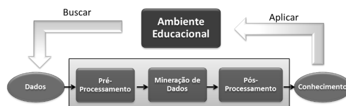
Figura 1 - Etapas da Mineração de Dados Educacionais.

O processo de EDM converte os dados brutos de sistemas educacionais em conhecimento que pode ser usada por desenvolvedores de software educacional, professores, pesquisadores educacionais, entre outros. Esse processo não difere muito de outras áreas de aplicação de mineração de dados, porque ele se baseia nos mesmos passos do processo de mineração de dados em geral, conforme mostra a Figura 1 [García et al. , 2011].