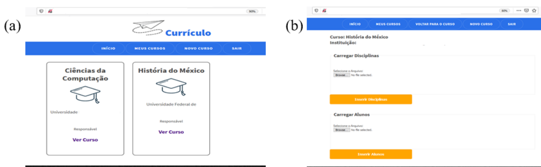
Figura 2. Interface Inicial e de Cadastro de Novo Curso

A implementação inicial se concentrou na dinâmica de funcionamento do ambiente, norteada pela possibilidade de sua gestão e uso por docentes de diferentes áreas do conhecimento, não exigindo conhecimentos técnicos avançados. O acesso é baseado em cursos e em papéis. Assim, o acesso exige que seja realizado login e, após o acesso, o usuário só tem a visibilidade dos cursos aos quais está relacionado (Figura 2a). É possível estar relacionado com o curso como responsável ou como colaborador. O responsável é aquele que cria e insere informações sobre o curso, sendo possível adicionar colaboradores que poderão ter acesso às informações sem poder de edição. Para cadastrar um novo curso, não é necessária mediação com os mantenedores do ambiente, bastando apenas preparar corretamente o arquivo csv no modelo fornecido e realizar os uploads ao cadastrar o curso (Figura 2b).