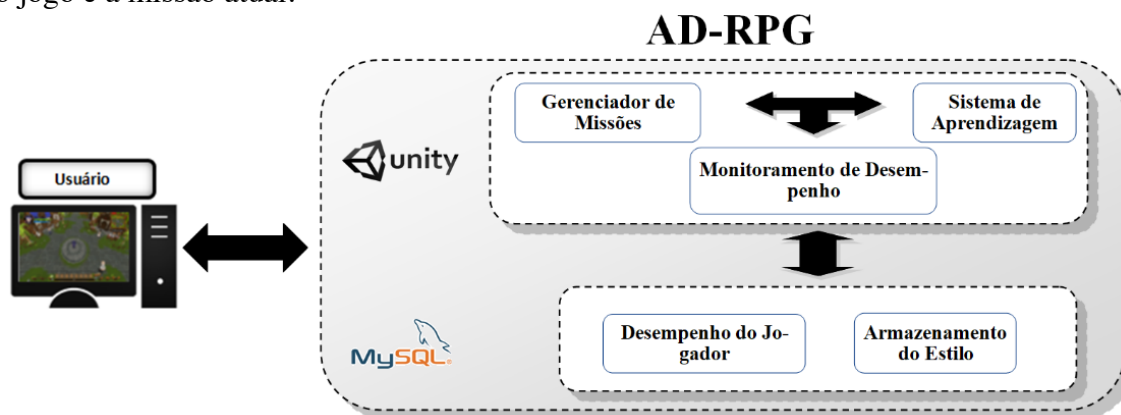
Figura 1. Arquitetura do jogo

material de apoio deve ser apresentado ao aluno, de acordo com uma estratégia de adaptação automática que considera o estilo de aprendizagem do estudante, bem como a trajetória dele no jogo e a missão atual.