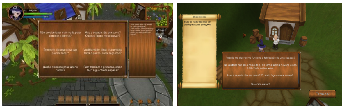
Figura 4. Segunda Missão – Planejamento e Execução de Entrevista.

Neste caso, o primeiro passo deve ser o planejamento da entrevista, no qual o jogador escolhe, quais perguntas deseja aplicar durante a entrevista. Do ponto de vista de Engenharia de Software, esta pode ser considerada uma entrevista formal e estruturada, na qual as perguntas são planejadas com antecedência. Por limitações de implementação optou-se por um conjunto limitado e fechado de questões. No entanto, cabe ao estudante selecionar as questões que considera relevantes e importantes no contexto desta entrevista, bem como a ordem em que ele deseja aplicá-las, pensando em diretrizes para condução de uma boa entrevista (CARVALHO e CHIOSSI, 2001). Ressalta-se, novamente, que os materiais de apoio sobre a técnica, envolvendo conceitos e diretrizes para realização, estão disponíveis ao estudante, que pode visualizar os mesmos quando desejar.