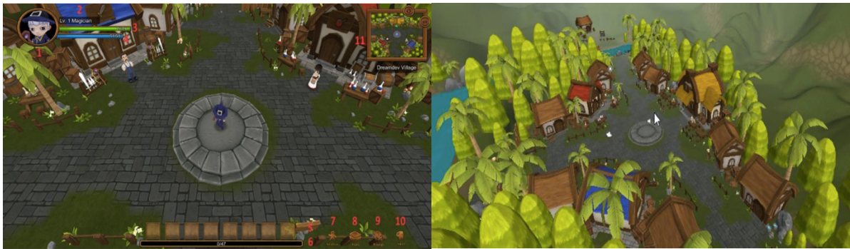
Figura 2 – Interfaces do Jogo AD-RPG - à esquerda, interface do jogo; à direita, visão geral da vila - (Fonte: do autor)

dos materiais educacionais presentes no jogo. O jogo começa sua narrativa com uma introdução, contextualizando o jogador na história e justificando os eventos que se seguirão, sendo conduzido, após, a uma fase-tutorial, na qual são apresentados os conteúdos educacionais sobre o uso da interface e características do ambiente. O jogador pode escolher ler ou ignorar o que está sendo apresentado a ele, seguindo este modelo de interação ao longo de todo o jogo. Depois que o jogador completa esta fase de apresentação, ele é transportado para a vila central da história, na qual sua principal aventura começa (Figura 2).