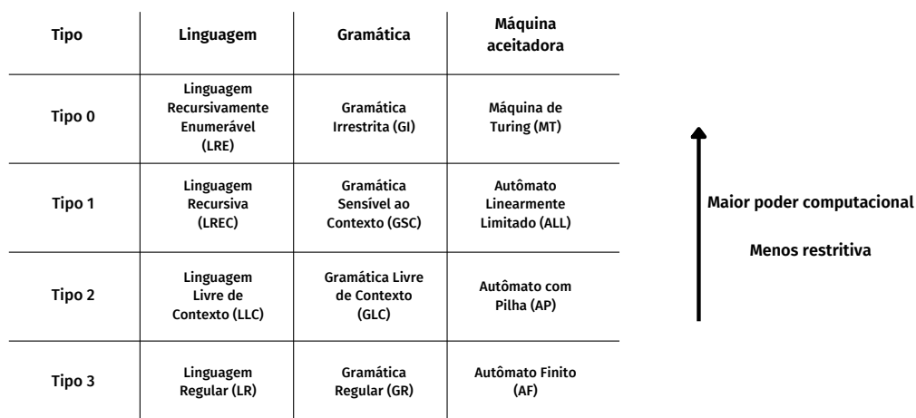
Figura 1. Hierarquia de Chomsky

Sua base de conhecimento é dividida em duas subáreas, a teoria dos autômatos e a teoria das linguagens formais, as quais eram consideradas independentes até a década de 60. A partir de pesquisas e resultados obtidos, principalmente pelo linguista Noam Chomsky em 1956, que essas duas subáreas foram unidas e se tornaram indissociáveis uma da outra [Ramos 2009]. O trabalho de Chomsky foi de prover sistemas formais para geração de palavras sintaticamente corretas [Sudkamp 2007], conhecido como Hierarquia de Chomsky. A Figura 1 ilustra a hierarquia e a associação entre as duas subáreas [Sudkamp 2007].